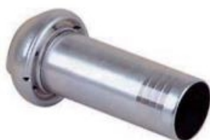
macho manguera ref. 534-M