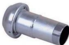
rosca macho ref. 536-R