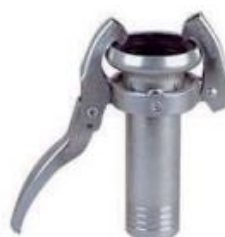
hembra manguera ref. 533-M