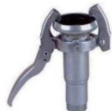
rosca macho ref. 535-R