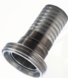
Racor INOX DIN macho