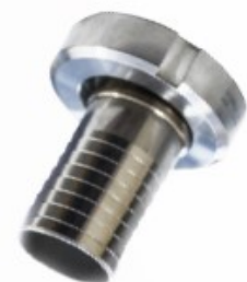
Racor INOX DIN hembra con tuerca